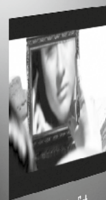
02 Secrets August 2016