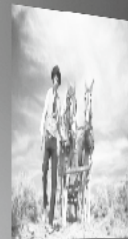
01 How Fast, Easy, Fast September 2016