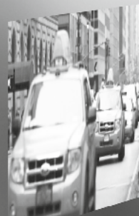
01 The Conflict